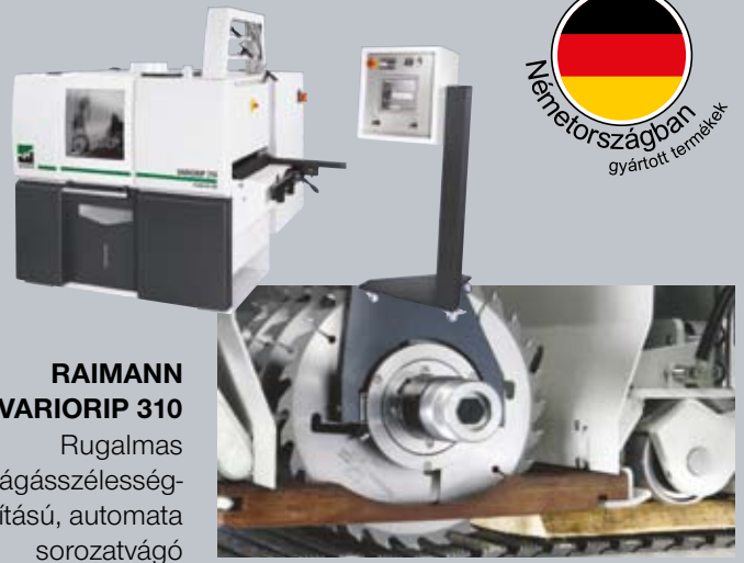
RAIMANN VARIORIP 310

Rugalmas vágásszélesség- állítású, automata sorozatvágó