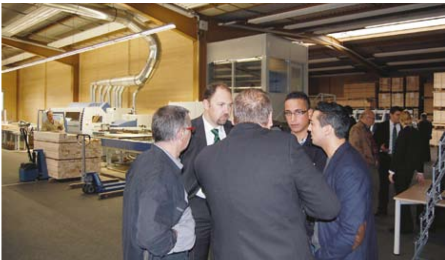
A rendezvény lehetőséget biztosított a szakembereknek a tapasztalatok kicserélésére

A gépkezelő által beszállított szélességi adatok alapján a Weinig TimberMax