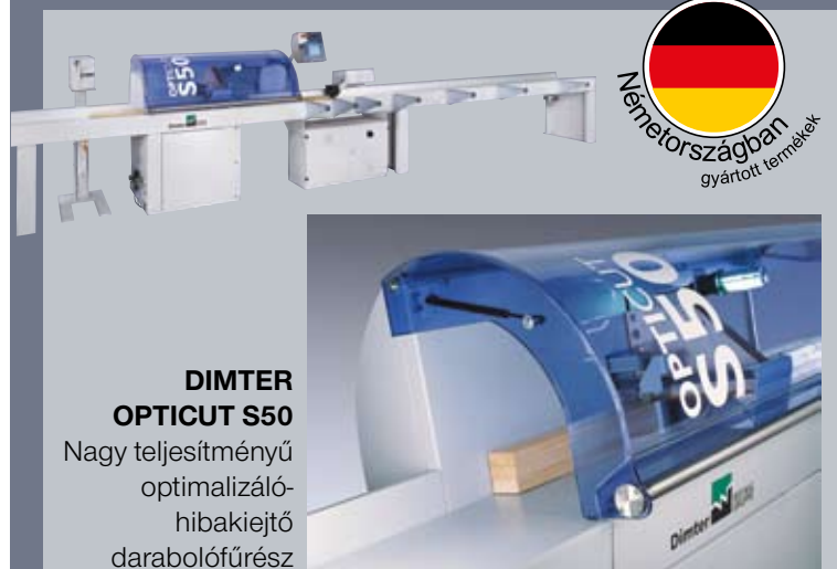
DIMTER OPTICUT S50

Nagy teljesítményű optimalizáló- hibakiejtő darabolófürés