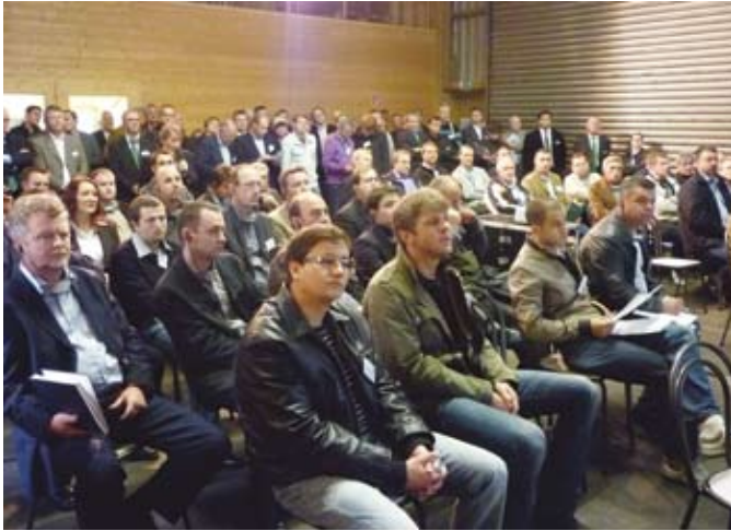
Az előadások érdekességét jól érzékelteti a telt házas részvétel

szélességoptimalizáló programja beállítja a sorozatvágó fűrészlapjait annak függvényében, hogy az adott szélességű deszkából milyen módon készülhetnek a kívánt méretű fűrészárúk, illetve táblásított lapok alkatrészei. A sorozatvágó fűrész már ennek megfelelő laposztással „várja” az anyagot, és nagy előtolási sebességgel elvégzi a szeletelést.